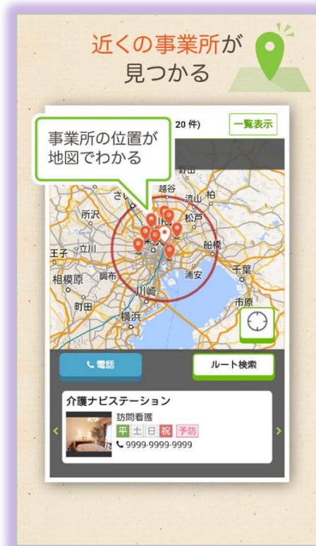
現在地からの距離や道順が分かる