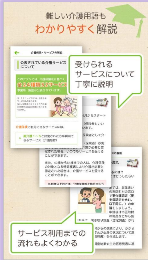
介護保険制度やサービスの利用手順等がイラストで解説