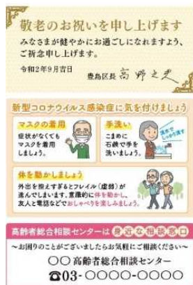
【必要に応じ訪問支援】