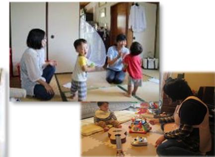
育児支援のイメージ