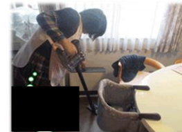
家事支援のイメージ